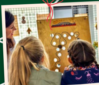
Il y en aura pour petits et grands dans la salle Publique