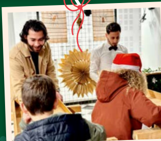
Les jeux sont conçus et imaginés par les animateurs de la Ville