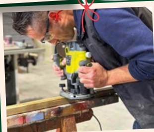
Chaque pièce est préparée et assemblée par les agents municipaux