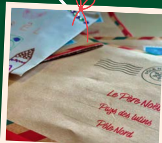
Les lutins de la Mairie envoient chaque année vos lettres au Père Noël