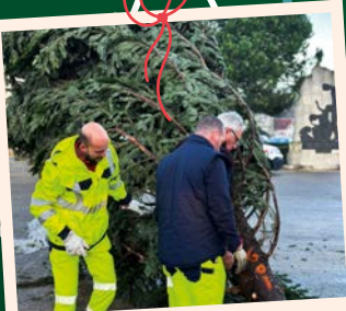
Les Services Techniques installent le sapin du Village de Noël