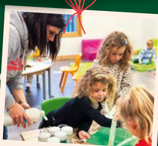
Les préparatifs des décorations par l'Accueil de Loisirs Maternel