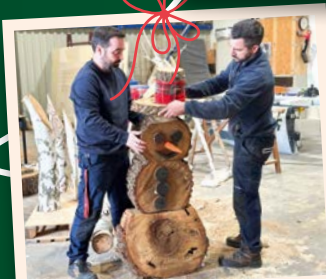
Le décor est conçu aux ateliers des services techniques