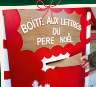
Postez votre liste dans la boîte aux lettres réalisée par les Services Techniques